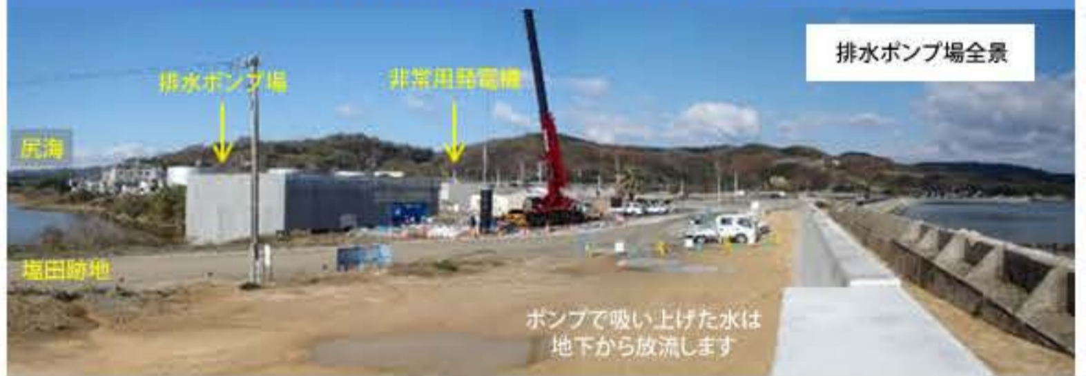
排水ポンプの予備ポンプを増設し、ポンプ場建屋も改修します

現在のポンプ場が建設された時(昭和34年)にポンプ増設を想定して床に穴が開けられています。そこに予備ポンプ(4台め)を設置することにしました。