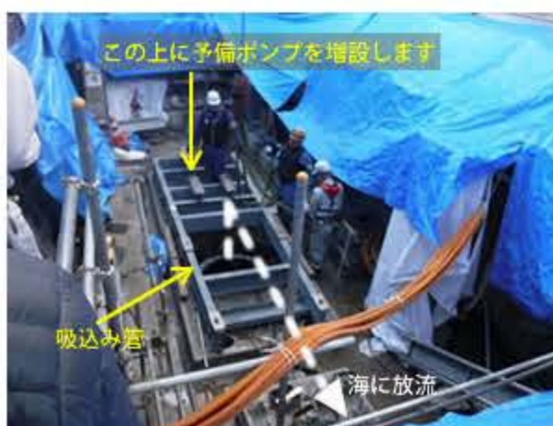
吸込み管を設置しました