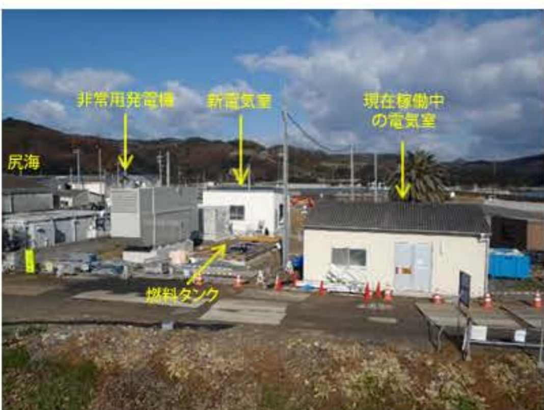
非常用発電機の設置が完了しました