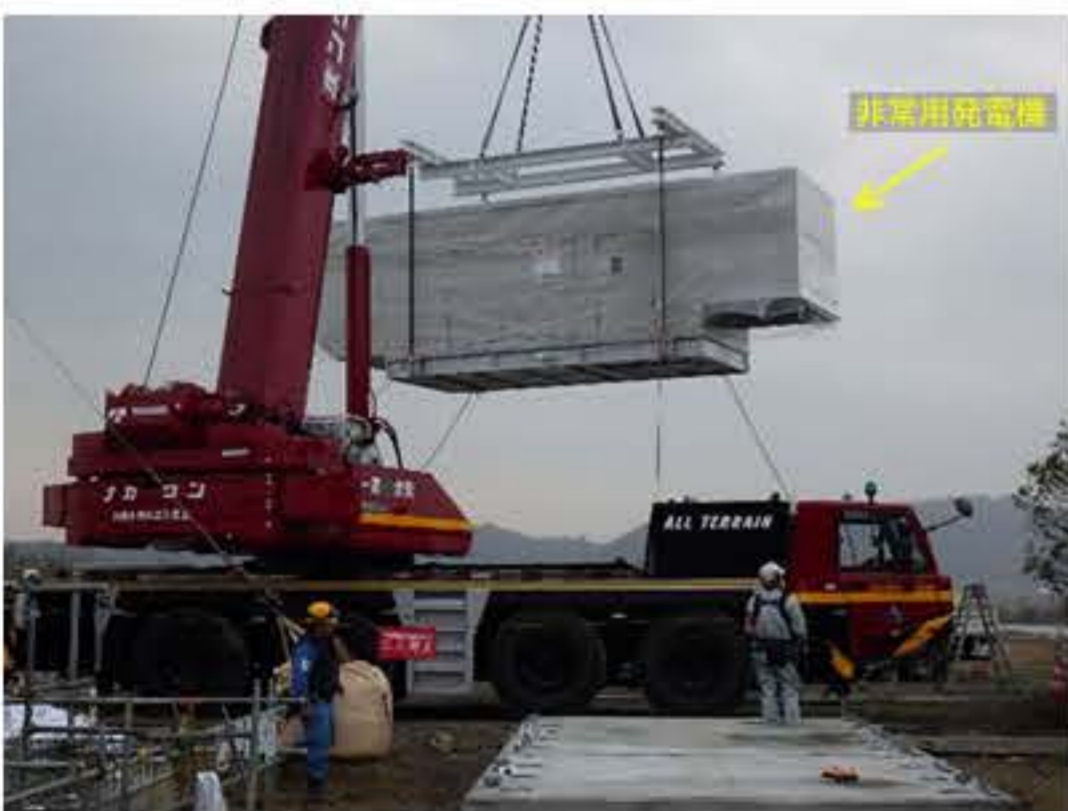
非常用発電機を設置している状況です

現在のポンプ場が建設された時(昭和34年)にポンプ増設を想定して床に穴が開けられています。そこに予備ポンプ(4台め)を設置することにしました。