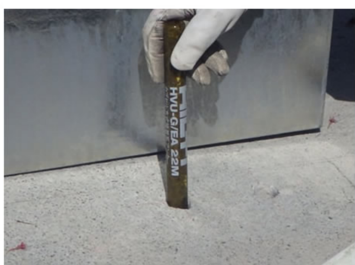
⑤ 樹脂と硬化剤がガラス管に入っていてアンカーを打ち込むと 固着されます