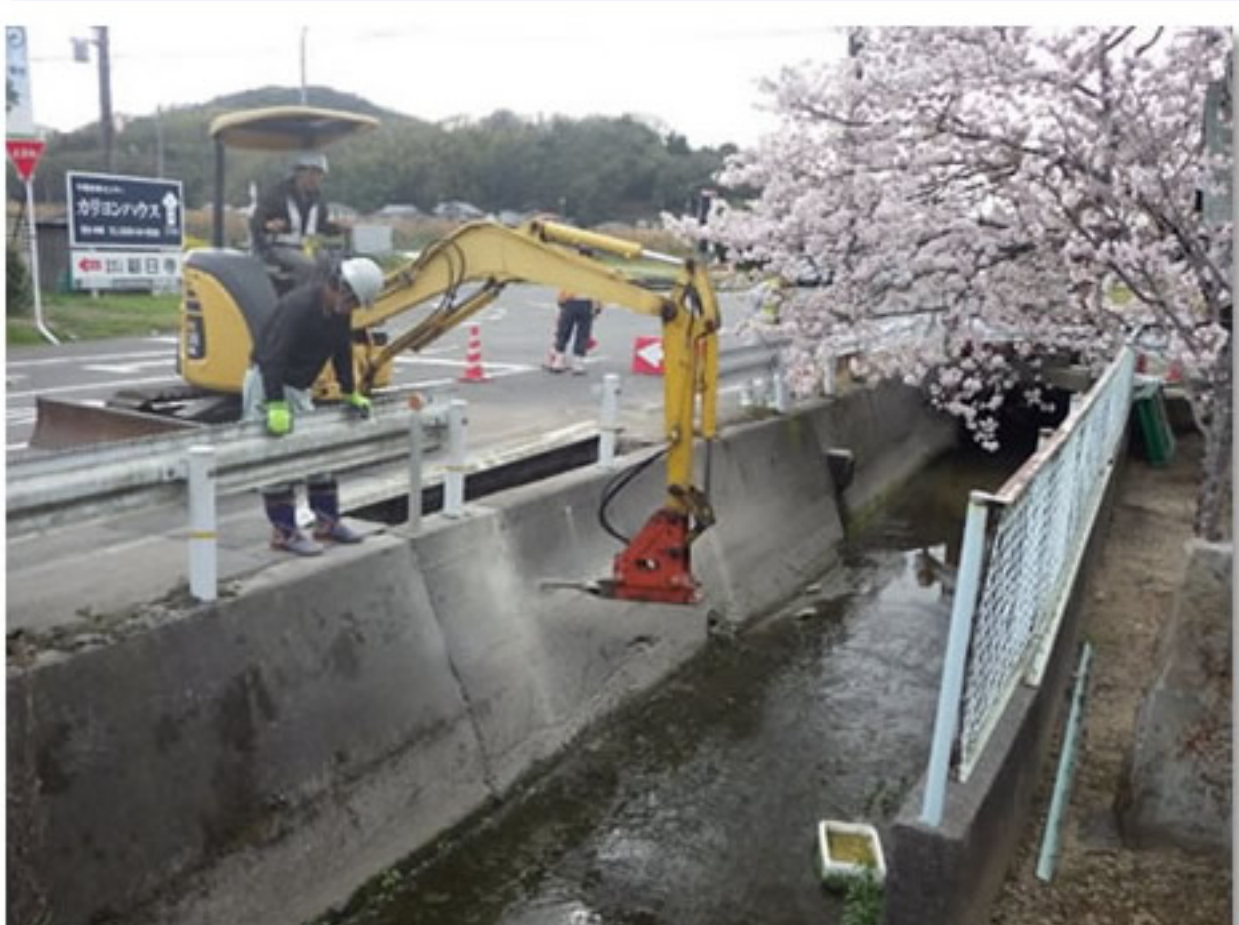
① 橋の土台を造るためにコンクリートを壊しました