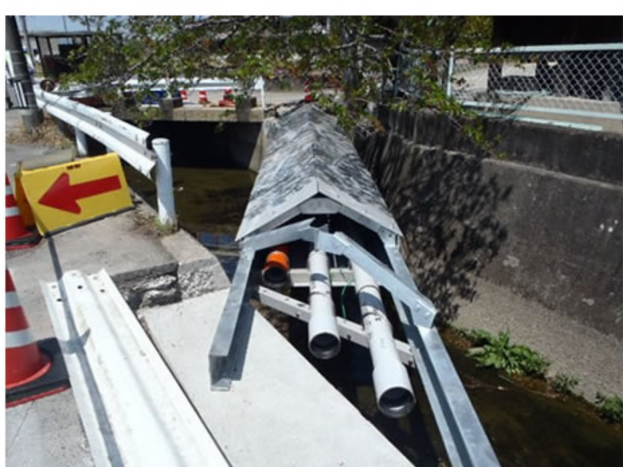
⑥ 電線管の橋が完成しました