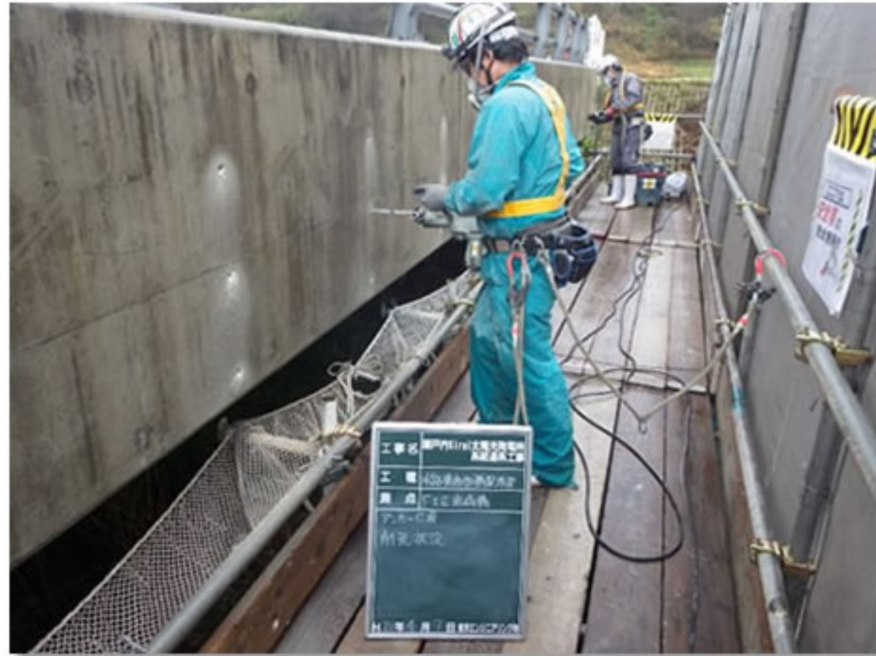
② 金具を固定するために橋に孔を開けました