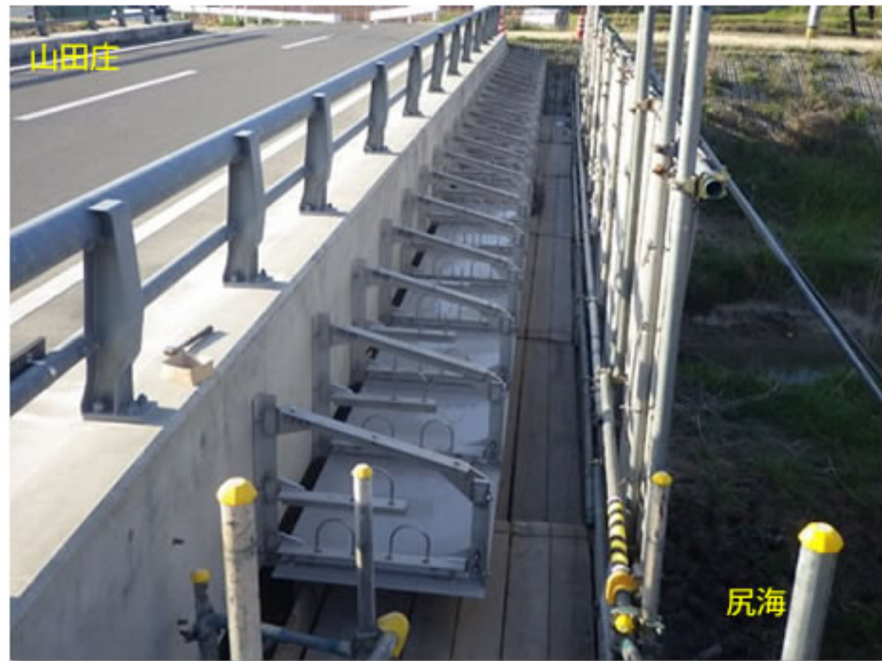
③ 金具を橋に固定しました