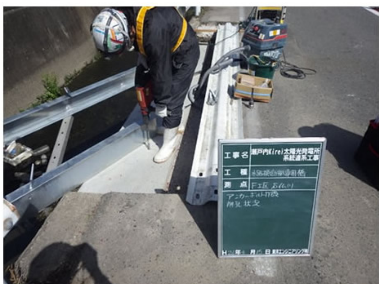
④ 橋げたが動かないようにアンカーで固定しました