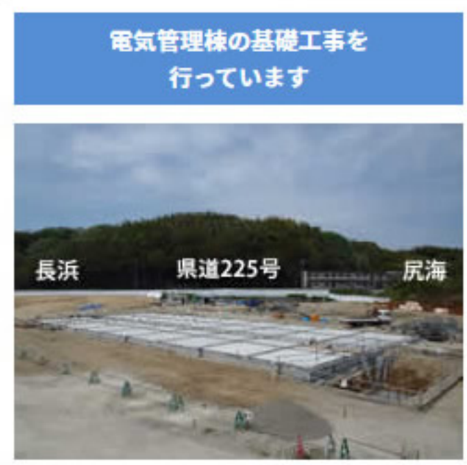
電気管理棟の基礎工事を 行っています