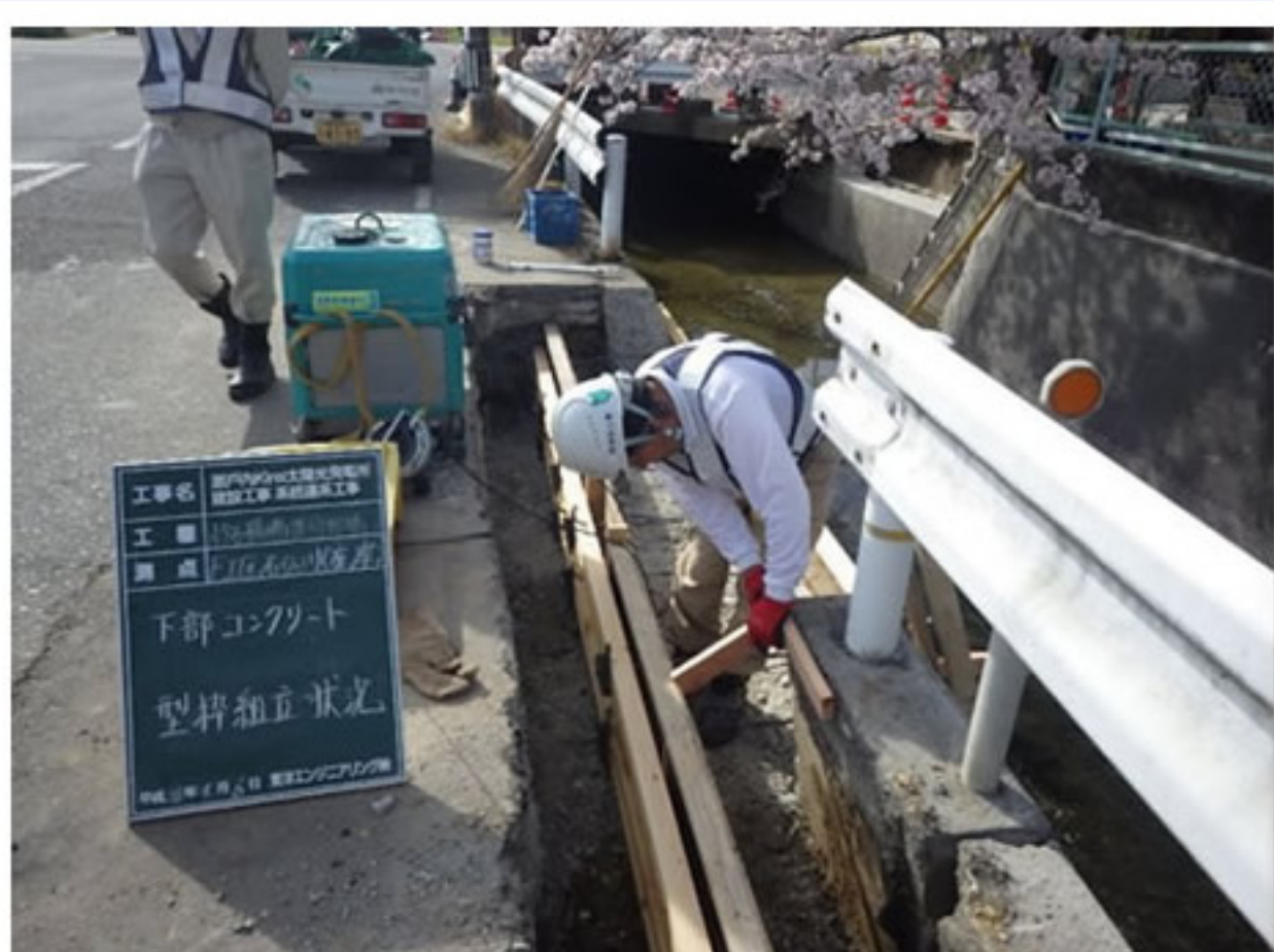
② 型枠を組んでコンクリートを打設しました