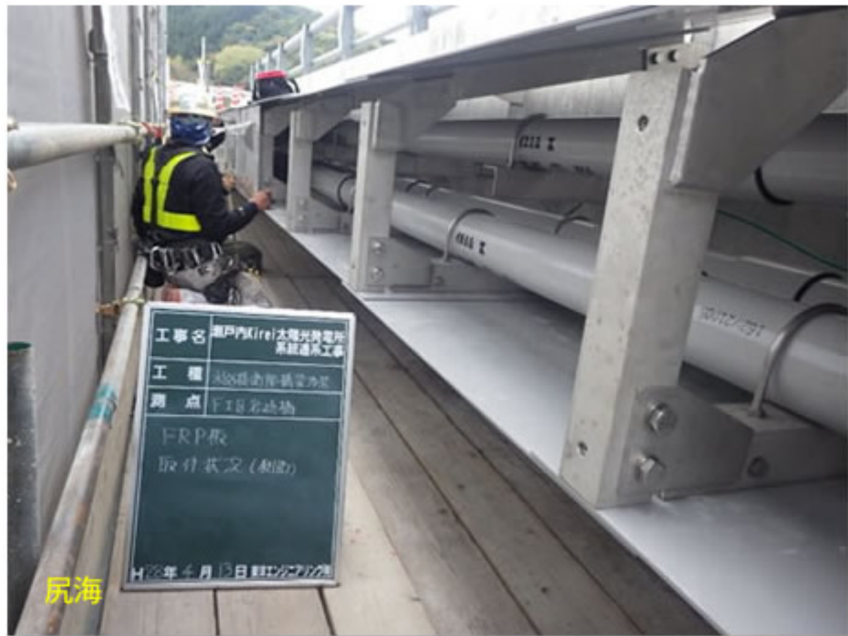
④ 金具に電線管を取り付けました