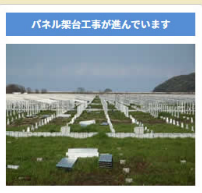
パネル架台工事が進んでいます