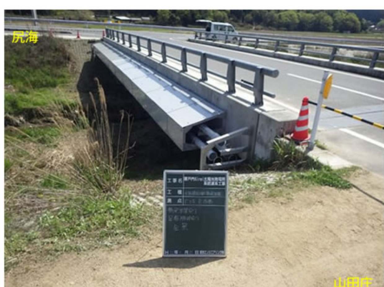
⑤ 電線管の取付けが完成しました