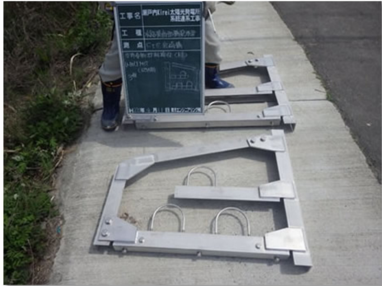
① 電線管を取り付ける金具です