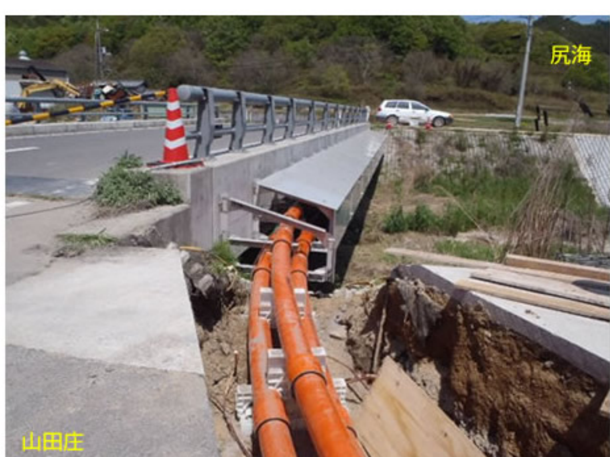
⑥ 開削部からの地中用の電線管と接続しました