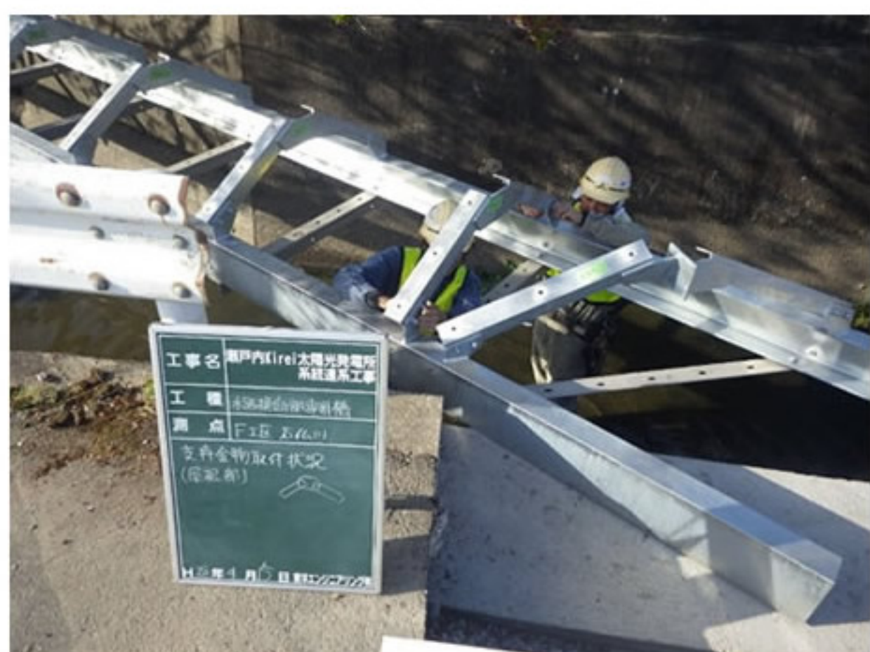
③ 橋げたを組み立てました